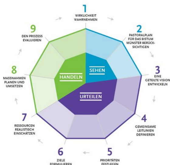
Grafik 1: Schritte in der Entwicklung eines lokalen Pastoralplans. (Anklicken zum Vergrößern)